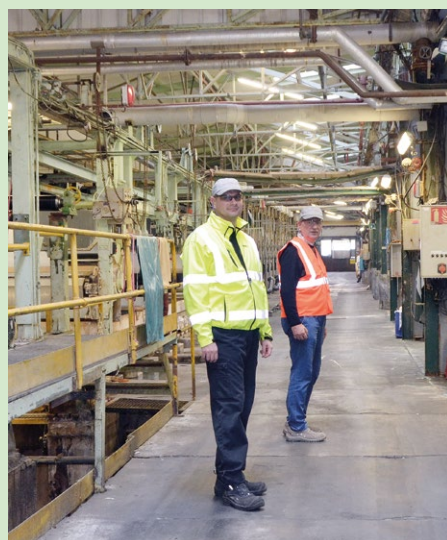
A Ahlstrom usa processos especiais de produção para sua linha de produtos especiais.